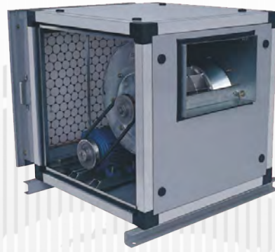
COM GAVETA PARA FILTROS