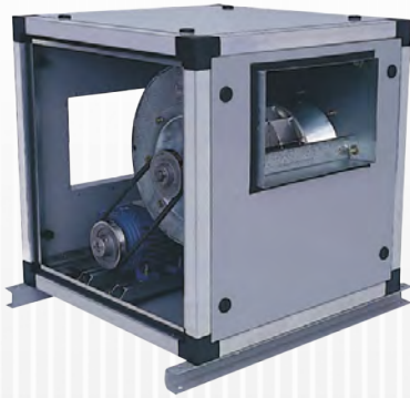
SEM GAVETA PARA FILTROS